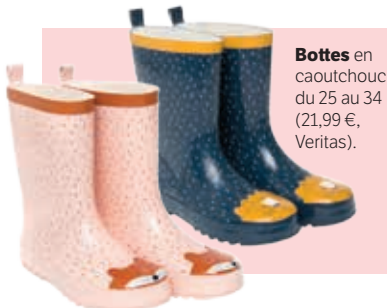
Bottes en caoutchouc du 25 au 34 (21,99 €, Veritas).

À partir de 25 €/mois, de 0 à 6 ans, plus d'infos sur kidsbox.lu.