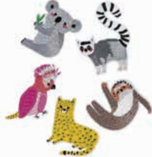
Set d'animaux thermocollants (3,25 € chez Hema).